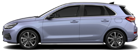
Meta Blue Pearl