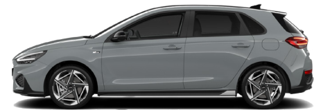
Shadow Grey nur für N Line