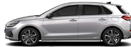
Shimmering Silver Metallic