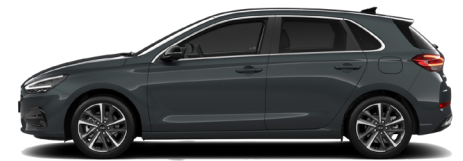
Cypress Green Pearl