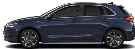
Sailing Blue Pearl