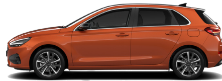
Jupiter Orange Metallic