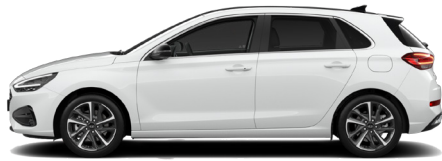
Serenity White Pearl