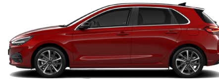
Ultimate Red Metallic