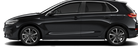
Abyss Black Pearl