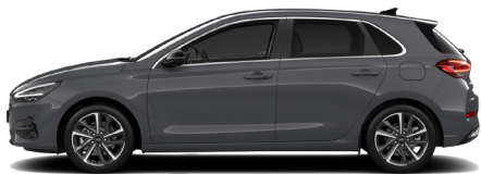
Ecotronic Grey Pearl