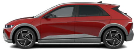
ohne Aufpreis Ultimate Red Metallic