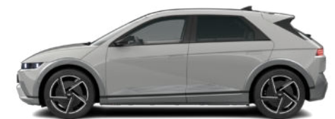
Cyber Gray Metallic