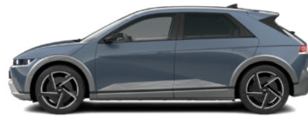
Lucid Blue Pearl