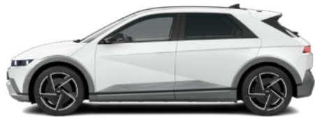
Atlas White Matte