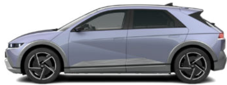
Meta Blue Pearl