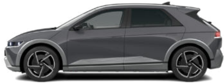
Ecotronic Gray Pearl