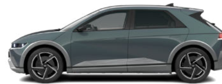
Digital Teal-Green Pearl