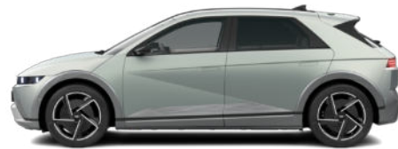
Celadon Gray Matte