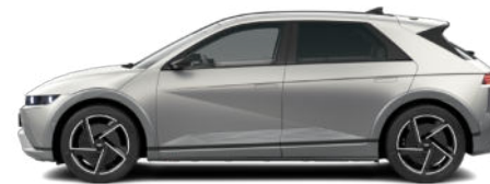
Gravity Gold Matte